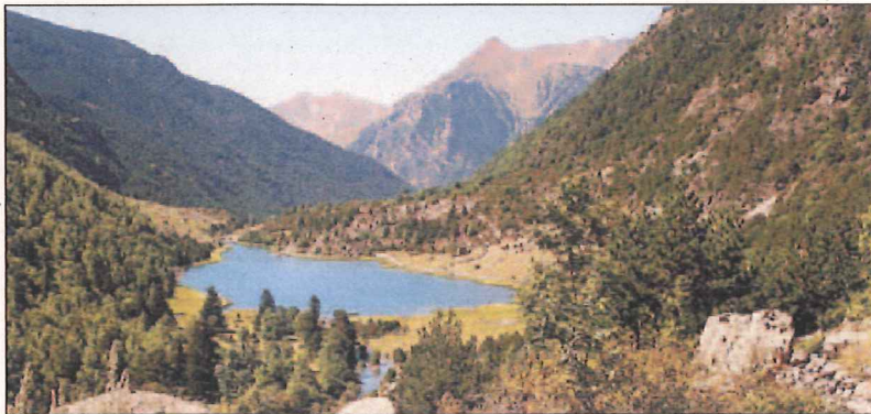
Estany de Sant Maurici

L'Assemblea General de les Nacions Unides va declarar aquest 2011 Any Internacional dels Boscos amb la finalitat de sensibilitzar l'opinió pública sobre la importància de la gestió sostenible i de la conservació dels boscos. D'aquesta manera, l'ONU ha volgut celebrar l'existència dels boscos del món i dels homes que en viuen i els fan viure, i recordar així allò que els boscos aporten a la humanitat, en un moment en què a moltes regions aquest patrimoni està amenaçat per la desforestació, per la qual cosa cal prendre mesures per conservar aquesta riquesa natural. A escala planetària, es calcula que són 300 milions les persones que viuen en els boscos i que la subsistència d'altres 1,8 mil milions de persones depenen directament dels boscos. Boscos que, per altra part, apleguen al seu si el 80% de la biodiversitat mundial. Tanmateix, cada any aquestes zones experimenten una disminució de 13 milions d'hectàrees que són desforestades, principalment en la zona tropical. Segons els experts, els boscos realitzen tres funcions fonamentals. En primer lloc, una funció mediambiental. El bosc fixa anualment la meitat del diòxid de carboni produït per l'activitat del transport, alberga una flora i una fauna molt variada i és un ecosistema la biodiversitat del qual és molt important i variada. A més, en segon lloc, els boscos realitzen una funció productiva, ja que constitueixen l'origen d'una gran quantitat de