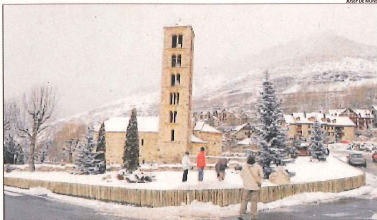
Els turistes van aprofitar per fer fotografies del romànic cobert amb una bona capa de neu.