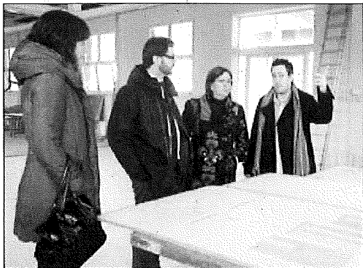
El director general de Juventud vistió el Espai Jove

La primera edil de Tàrrega avanzó que en los presupuestos municipales de este año se incorporará una par-