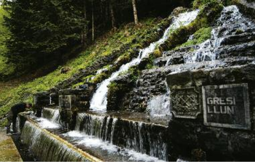
Val d'Aran es sinónimo de clima atlántico y, por tanto, de humedad. He aquí una muestra. Arriba, la Hònt deth Gresilhon. A la derecha, los Uelhs deth Joeu. Debajo, Canejan, uno de los pueblos mejor conservados de la Val d'Aran.