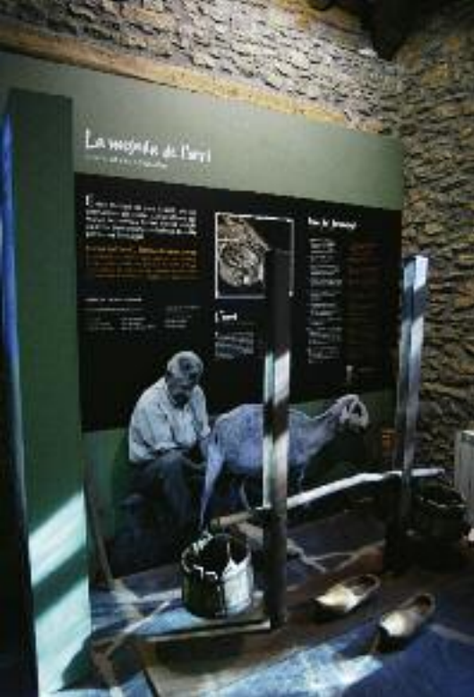
Arriba, detalle del Museo del Pastor de Llessui. A la derecha, el Museo de las Mariposas de Pujalt y, debajo, una auténtica casa aranesa en Sant Joan de Toran.