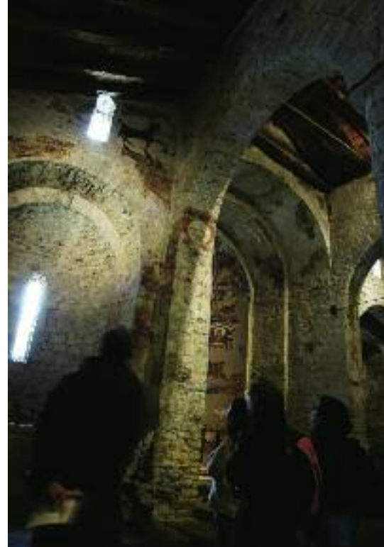
Arriba, el interior de Sant Climent de Taüll. A la izquierda, Sant Joan de Boí. En páginas anteriores, la Artiga de Lin, en la Val d'Aran.

Justo cuando comenzábamos a pensar que, en cierto modo, ya lo habíamos visto todo por esta redacción, sobre todo en relación a un enclave tan famoso para los viajeros como los Pirineos, nos surgió la oportunidad de realizar una nueva incursión en esta zona de Catalunya. Un viaje que, afortunadamente, nos ha puesto de nuevo los pies en la tierra, demostrándonos que el Pirineo de Lleida esconde todavía muchos atractivos por descubrir.