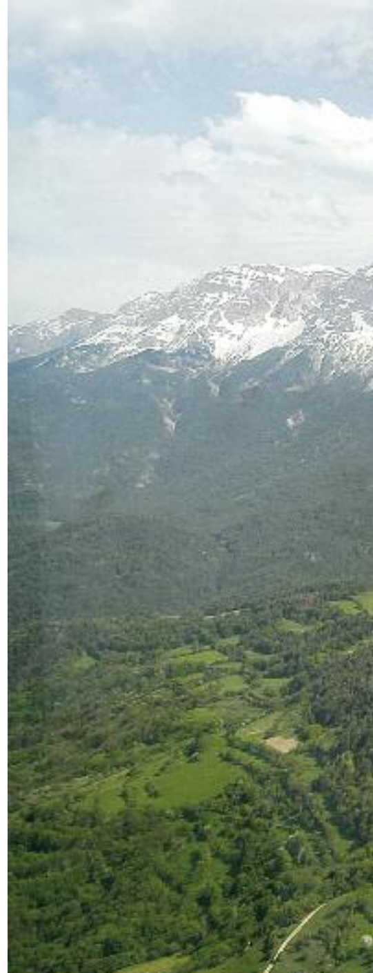
A la izquierda, una calle de Organyà. Arriba, la panadería de Coll de Nargó. Sobre estas líneas, la Sierra del Cadí a vista de pájaro.

des pueden ser comprendidas en la moderna sala de exposiciones habilitada junto a la oficina de turismo.